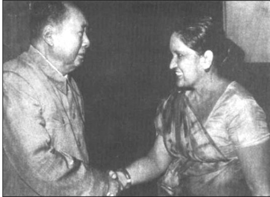
බණ්ඩාරනායක මැතිණියට වීන ජනාධිපති මාවෝ සේතුං ගමුවු අවස්ථාවක