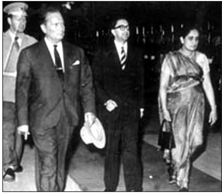
බණ්ඩාරනායක මැතිණිය සහ යුගෝස්ලාවියා ජනාධිපති විටෝ 1971 කොළඹ දී