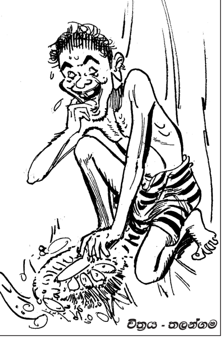
ව්‍යාස - තන්තම

සර් ඩී. බී. ජයතිලක හෙවත් දොන් බාරොන් ජයතිලක මහතා 1948 අප රටට නිදහස ලැබෙන්නට පෙර ඒ නිදහස් සටන සඳහා කැපවී කටයුතු කළ දේශප්‍රේමීන් අතර මුල් පෙළ හෙබවූ කෙනෙකි. නිදහස ලබන්නට පෙර වූ රාජ්‍ය මත් ත්‍රණ සබාවේ සහිතයෙකු වූ ඒ මහතා ඉංග්‍රීසි, සිංහල, පාලි, සංඝකෘත ආදී භාෂාවන්හි හසල දැනුමක් ලැබ සිටියේ ය. 1936 දී පමණ ශ්‍රීලංකාවට විශ්ව විද්‍යාලයක් අවශ්‍යයි සුදු පාලකයින්ගෙන් නොනවතවා ඉල්ලා සිටි දේශප්‍රේමීන් අතර බාරොන් ජයතිලක, පොන්නම් බලම් රාමනාදන්, අරුණාවලම් ආදී අය වූහ. ඒ ඉල්ලීමේ