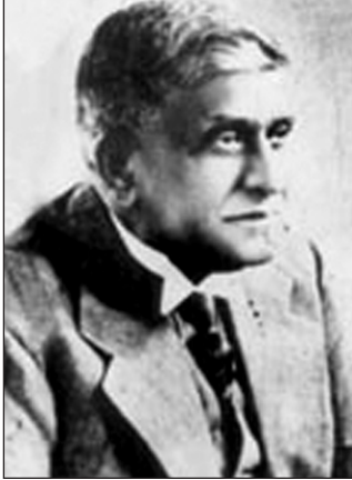
සර් ඩී. බී. ජයතිලක

මගේ සුන්දර ලමා කාලයේ මම විවිධ පළාත් වල පාසැල් හතරක ඉගෙනුම ලැබුවෙමි. ඒ අතරින් එක් පාසැලක් වූයේ ගාල්ලේ පිලානේ බෞද්ධ මිශ්‍ර පාඨ ශාලාවයි. එය මා සාහිත්‍යයට යොමුකළ පාසැල් මාතාවයි. එකල හතරවන ප්‍රමාණයේ සිසුන්ට නියම කරනලද පොත් අතර පද්‍යා රසය නම් කවි එකතුවකින් සමන්විත රසවත් පද්‍ය සංග්‍රහයක් විය. මෙහි පළ වන වැල කෑ පබ්ලා එහි වූ එක් පද්දි පෙළකි. වැල වරකා ගැන විශේෂ දැනුමක් ඇත්තේ ගමේ ලමයින්ට ය. වැල, කොස් ගනේ රස පළතුරක් වන නමුත් කුඩා ලමයින්ට එය කැමට නොදෙන්නේ ඔවුන්ට එවා අපහසුයි වැඩිහිටියන් සිතන බැවිනි. මේ වැල කෑ ලමයෙකුට සිදු වූ දේ ය. හාසායෙන් යුත් මේ කවි පෙළ රචනා කරන ලද්දේ ශ්‍රීලංකාවේ ප්‍රකට විද්වතුන් හා අතීත නිදහස් සටනේ පුරෝගාමියෙකුද වන දේශප්‍රේමී අභාවප්‍රාප්ත ශ්‍රීමත් දොන් බාරොන් ජයතිලක විද්වතුන් විසිනි. - දියා