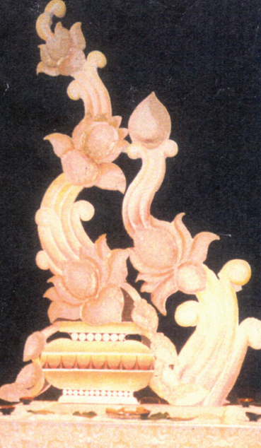
හෙළ කලා ශිල්ප විද්‍යාලය වන්දන තැනූ මගුල් පෝරුවක්

පිරිනැමුණේ වන්දන සෙනෙවිරත්නටය. විවාහයෙන් පසු තම ආදරණීය බිරිඳ වූ තෙරේසන් පෙරේරා නමැති ගුරු වෘත්තියෙන් සමුදාන එංගලන්තයේ වාසයට පැමිණි පසු අධ්‍යාපන දෙපාර්තමේන්තුවේ රැකියාවක නිරතව සිටි පසුව චිත්‍ර ගුරුවරයෙකු ලෙස සේවය කරන්නට ලැබීම සිය භාග්‍යයක් සේ ඔහු සලකයි. එසේම ඒ කාලය තුළ ලාංකික මෝස්තර, බිත්ති, චිත්‍ර, වෙස් මුහුණු, ගොක් කලාව ආදිය පිළිබඳව යුරෝපීය යන් දැනුවත් කිරීමට ලද අවස්ථාවෙන් තමා උපරිම ප්‍රයේජනය ගත් බව වන්දන පවසන්නේය. සිය කලා කුසලතාවන් නිසාම වන්දන ඉතා වික කලකින් ශ්‍රී ලාංකිකයින් අතර ජනප්‍රිය වර්තමානයේ බවට පත්විය. දැනට කලාතරණයක් කිසිසේ ලන්දනයේ පැවැත්වෙන බොහෝ සංගීත සංදර්ශණ, අවුරුදු උත්සව, පිරිත් සජ්ජායනා, පෙළපාලි ආදියට අවශ්‍ය සැරසිලි, චිත්‍ර හා නාම පුවරු ආදිය සැකසෙන්නේ ඔහු අතිනි. දැනට වසර 20 කට පමණ ඉහත දී කටයුතුකොට ගන්නා අන්තෝති විද්‍යාලීය ආදි ශිෂ්‍ය සංගමයක් එංගලන්තයේ පිහිටුවීමට පුරෝගාමියා වූයේ වන්දන ය. එලෙසම එංගලන්තයේ වසරක් පාසා පැවැත්වෙන මහා ක්‍රිකට්