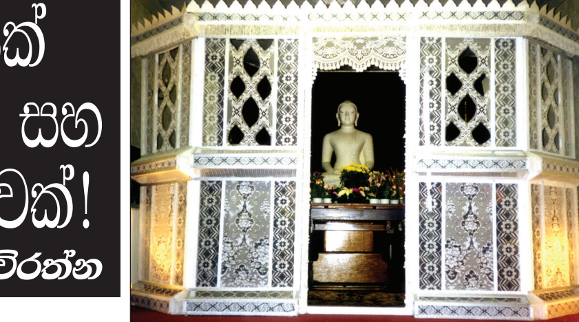
වන්දන සැදූ ලන්දනයේ කිංස්බරි විහාරයේ පිරිත් මණ්ඩපය

ශ්‍රී ලංකාවේ ජාතික චිත්‍රපටයක් ද, ක්‍රීඩකයානි ආගම හා සංස්කෘතියක්ද මුල් බැසගෙන ඇති එංගලන්තය නම් මේ රටේ සුඵ්තරයක් වූ සිංහල ජන කොට්ඨාශය අනෙක් සුඵ් ජාතික අතර අද කැපී පෙනෙන පිරිසක්ව සිටිති. 50 දශකයේ පමණ සිට කීප දෙනෙකුට පමණක් සීමාවූ සිංහල සිනමා සංඛ්‍යාව මෑත කාලයේ සැහෙනට වර්ධනය විය. ඒ කෙසේ වුවද සිංහලයාට ආවේණික සංස්කෘතික හා කලාත්මක ගති ලක්ෂණ පෙන්වූ කලාකරුවන්ට මෙහි ලද ඉඩකඩ හා අවස්ථා ඉතාම විරල විය. එසේ කිවුණු එංගලන්තය පසුගිය දශක දෙක තුළ වෙනස්වනු ඇති දුටුවේ මු. වැඩි වැඩියෙන් විවිධ ජන කොටස් පැමිණෙන්නට වීමත් සමග ඔවුන්ගේ සංස්කෘතිකාංග ලන්දනය පුරා පුද්ගලයන් වෙද්දී සිංහල හඬ ද ඒ අතරේ නැගෙන්නට විය. සිංහල සිංදු ඇසෙන්නට විය. සිංහල චිත්‍රපට දකින්නට ද, සිංහල නාට්‍යය වේදිකාගතවන්නටද, සිංහල පුවත්පත් කියවන්නට ද, සිංහල බොජුන් රස විඳින්නට ද හැකිකම උදාවිය. සිංහලකම, සිංහල කලා ශිල්ප, සිංහල සිරිත් විරිත් විදේශයක රැකගත ඉදිරියට පවත්වාගෙන යාම පිණිස වෙනස වූ සිංහලයෝ බෙහෝ දෙනෙක් එංගලන්තයේ වෙති. ඒ අය අතුරින් එක් විශේෂ පුද්ගලයෙකු ගැන මෙසේ සටහනක් තබන්නට මම අදහස් කළෙමි. ඔහු නම් අද ලන්දනයේ වෙසෙන සෙනෙවිරත්න දෙනා නම කී පමණින් හඳුනා වන්නේ සෙනෙවිරත්න ය.