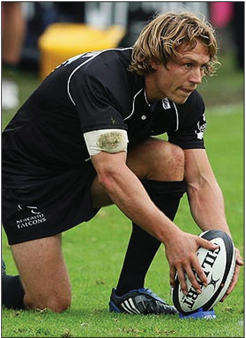
England rugby hero Jonny Wilkinson with his longer hair and more relaxed attitude playing for the Newcastle Falcons last weekend

ග්‍රාම ආරක්ෂාවට වෙනම ගැමියන් කණ්ඩායමක් පුහුණු කර යෙදවීමේ අවශ්‍යතාව රජයට දැනුණි.