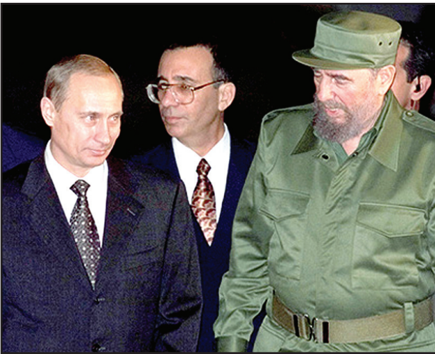
Putin with former Cuban leader Fidel Castro

විලැඩ්මිර් පුටින් රුසියාවේ ලෙනිංග්‍රාඩ් නගරයේ දී 1952 ඔක්තෝබර් මස සාමාන්‍ය කම්කරු පවුලක උපත ලැබීය. ඔහු සිය නිවස අසල පාසැලක ප්‍රථම අධ්‍යාපනය ලද අතර එහි ද්විතීය පාසැලක විශ්වවිද්‍යාල ප්‍රවේශය මට්ටම දක්වා උගත්තේය. පාසැල් විශේෂී ඔහු විශේෂ දක්ෂතා දැක්වූ බවක් නොපෙනේ. එහෙත් සිය අනාගතය ගැන උනන්දුවෙන් කටයුතු කළ බවට සාක්ෂි ඇත. එනම් ඔහු 1970 දී විශ්වවිද්‍යාල ප්‍රවේශ මට්ටම සමත් වූ විශ්‍ය ලෙනිංග්‍රාඩ් නගරයේ එදා තිබුණු KGB කායාලයට ගොස් එහා ප්‍රධානියාම හමුවී තමා KGB සේවයට ගන්නා ලෙස ඉල්ලීමක් කිරීමය. එකල KGB යනුවෙන් හඳුන්වනු ලැබූයේ සෝවියට් රාජ්‍යයේ ආරක්ෂක කටයුතු අංශයයි. දැනත්ම එය රාජ්‍ය පරිපාලන අංශය බවට පත්ව තිබේ. එවකට KGB යේ සේවය කිරීම ප්‍රබල රාජකාරියක් සේ සැලකු අතර, එය අනාගත නායකයන් බිහිකළ අයත්තයක් ලෙස සලකනු ලැබීය.