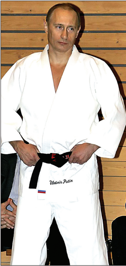
A fearless fighter Putin - a Black -belt Judo expert

දකුණේ අග වනවිටය. පාලන කන්ත්‍රය තුළ ඊළඟ පරම්පරාවේ නව නායකයන් බිහිවීමට පටන් ගැනීමත්, ක්‍රමයෙන් තෙල්මිල වැඩිවීමට පටන්ගැනීමත් මේ කාලය තුළ ඇරඹිණ. මේ යුගයේදී රුසියානු නායකත්වයට ක්‍රමයෙන් මතු වූ විලැඩ්මිර් පුටින් ප්‍රබල නව නායකත්වය යටතේ මේ වෙනස්වීම් ආරම්භ විය. මෙම වෙනස්වීම් 1999 න් පසු වෙනවත්වීම නිසා 2000 ප්‍රථම දකුණ තුළ රුසියාව ප්‍රබල එම රුසියානු සමූහාණ්ඩුව ප්‍රබල තත්වයට ආවේය. මේ ලියන්නේ ඒ පිබිදීමේ කථාන්තරයයි.