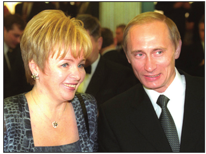
Putin with his wife Lyudimila

යුරෝපයෙන් නැගණහිර දිසාවට, ආසියා මහාද්වීපය මධ්‍යයේ පිහිටා ඇති විශාලම භූමි ප්‍රමාණයකින් යුක්ත වූ රට රුසියාවයි. සයිබීරියාව වැනි ශීත කාන්තාර වලින් යුතු මේ ප්‍රදේශවල භූ ගර්භයේ ස්වාභාවික තෙල් සහ ගෑස් ආකාර මහා පරිමාණයෙන් පවතී. මෙයට දකුණෙන් පිහිටි කසකස්ථාන් (Kaza khasthan), උස්බෙකිස්ථාන් ( Uzbekhistan), ටර්කමේස්ථාන් (Turkmeristan) ආදී රටවල් රාශියකද මේ තෙල් ඉල්ලම් ඇත. මේ රටවල් සියල්ලම එදා සෝවියට් සමූහාණ්ඩුවට අයත්වූ අතර එය බිඳවැටුණු පසුද රුසියා සමූහාණ්ඩුවට ( Russian Federation) තවමත් සම්බන්ධව පවතින රටවල් වෙති.