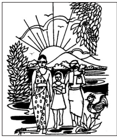
දමින් වතුර-ග ගලගොඩ මහා බෝධි මහා විද්‍යාලය අනුරාධපුර Sri Lanka

කෙක් යායෙන් වටවු මේ ගම්මා නේ මද සුළඟින් නිකරම සේදී යන් නේ කරමක් පිටිසර වුවද ගම්මා නේ සුන්දර බවින් නැත අඩුවක් දැනෙන් නේ ගම කෙළවර ඇත්තේ මහ කන්දක් ය ඉන් ඔබ්බට පිහිටියේ මහ කැලයක් ය තව කොනකින් ඇත්තේ දිය ඇල්ලක් ය ඇතට පෙනේ කිරි දහරක් ලෙසට මේ ය කඩමණ්ඩිය පිහිටියේ ගම කෙළවර ය මේ නැම දෙනා කවුරුත් හරිම සමගි ය ගමේ සිටින මිනිසුන් හරි එඩිතර ය මේ ගම දිනෙන් දින දියුලන පහනක් ය