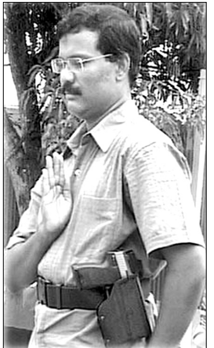
පිස්තෝලය ඉහේ ගහගෙන මියගිය කොටිටං ආචාර පුදකරන වෙල්වින්