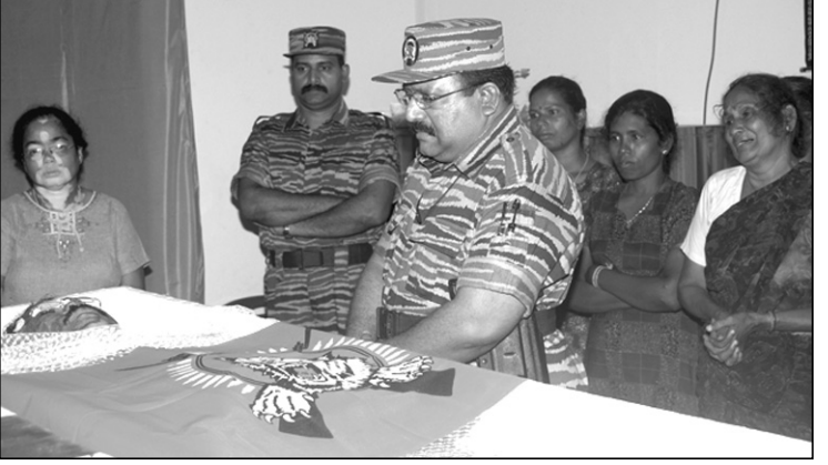
වෙල්වින්ගේ මිනියට ආචාර පාන කොටිනායක ප්‍රහාරකරු. “අනේ මටත් ඉතින් උහදිල මේ ඉරුම ම තමා” යයි ඔහු සිතනවා නොඅනුමානය. පසෙකින් අඩා වැටෙන්නේ වෙල්විමිගේ මව හා සොයුරියත්ය.

මියගොස් ඇතැයි ද ගුවන් හමුදා ප්‍රකාශකයා කීය. මේ අතර එල්.ටී.ටී.ඊ. සංවිධානයේ මූලස්ථානයද තම සංවිධානයේ දේශපාලන අංශ නායක බ්‍රිගේඩියර් නමිල් සෙල්වම් ඇතුළු නායකයන් හය දෙනෙකු ශ්‍රී ලංකා ගුවන් හමුදාවේ ප්‍රහාරවලින් මියගිය බව 3 වෙනි උදේ නිවේදනය කළා ය. මියගිය පසු වෙල්විමිට කොටි සංවිධානය බ්‍රිගේඩියර් තනතුරක් පිරිනමා ඇත.