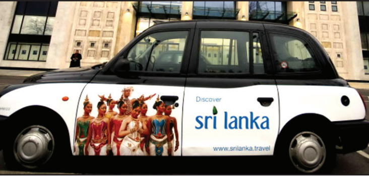
London cabs to promote Sri Lanka's tourism