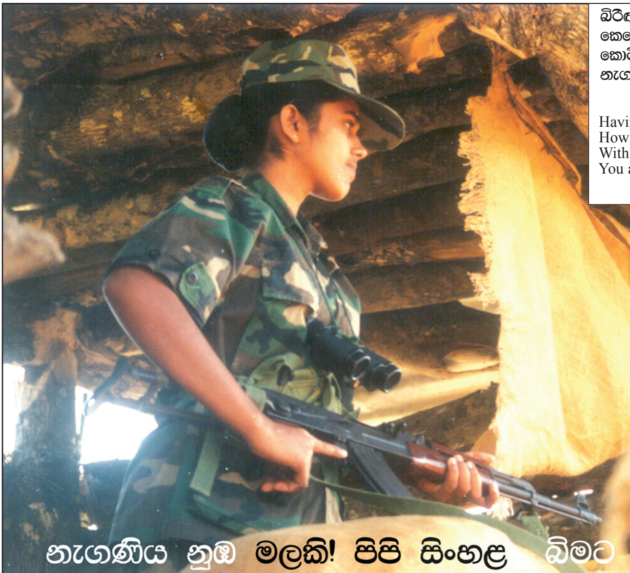
නැගණිය හුඹ මලකි! පිපි සිංහළ බිමට

MARCH 10, 2008 මාර්තු මාසය (බුද්ධ වර්ෂ 2551 මැදින් මාසය)