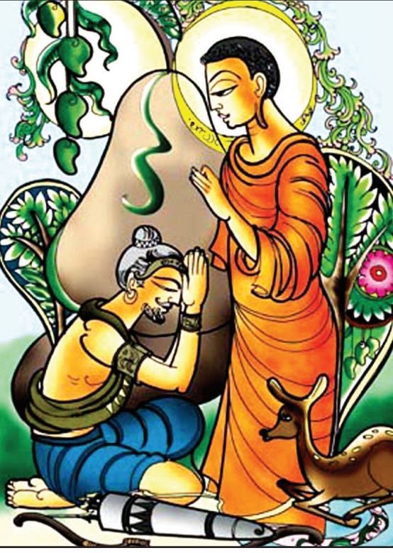
මුට් දඩයමේ මිහිඳු මාහිමියන්ගේ වහන්සේ මුට් දඩයම ලැබූ අයුරු දැක්වීමට අධ්‍යාපන අමාත්‍යවරයා විසින් මෙරට පැවති පෝෂිත සංස්කෘතිය විනාශකර දමන තෙක් වසර 2500 ක් අපේ සාඩ්මිබර උරුමය පෝෂණය වී තිබුණේ මිහිඳු මහරහතන් වහන්සේ අපට ගෙනැවිත් දුන් මා හැකි අධ්‍යාපනයෙනි. එම ක්‍රමවේදය අමාත්‍යවරයා ලෙස අපෙන් උදුරා විනාශකළේ අපේ අනන්‍යතාව, අපේ දියුණුව හා පොද්ගතව එහි මැනවින් රැකී තිබුණු නිසාය. විදේශ බලවේග විටින් විට තම අපේක්ෂා ඉටු කර ගැනීමට සමත් අධ්‍යාපන ක්‍රම වේදයක් අප වෙත බලෙන් පැටවීමට ඉන් අප ලැබූ දියුණුවක් නැති කරමි.

සමූද්ධ පරිනිර්වාණයෙන් වසර 200 කට පසුව පොසොන් පුර පසළොස්වක පෝදා ශ්‍රීලංකාවට වැඩිම කළ මිහිඳු මහ රහතන් වහන්සේ ශ්‍රේෂ්ඨ අධ්‍යාපන වේදියෙකි. මානව ඉතිහාසයේ ප්‍රථම ලේඛන ගත බුද්ධි පරීක්ෂණය ලෙසින් දැක්වෙන්නේ මිහිඳු මාහිමියන් ගේ ඒ අධ්‍යාපන ක්‍රමවේදයේ සමාරම්භක සිහිවටනයයි. අඹ පැනය හා කදානි ප්‍රශ්නය මගින් ලංකාවේ රජු අමතා ජාතියේ බුද්ධිය විමසූ උන්වහන්සේ ප්‍රඥා වන්කයින් සඳහා වූ අති සියුම් ගැඹුරු බුද්ධිමය සමගින් සුසුරු කලා වක් රටට දායාද කළහ. ජාතියක් ලෙස ශ්‍රීලාංකික අපට ලෝකයා ඉදිරියේ අභිමාන යෙන් නැගී සිටින්නට ශක්තිය ලැබුණේ මිහිඳු හිමියන් මෙරට දියත් කළ සාර්ථක අධ්‍යාපන ක්‍රමවේදය නිසාය. ශ්‍රේෂ්ඨ සංස්කෘතියක්, ක්‍රමවත් භාෂාවක්, ජීවන දර්ශනයක් හා අද්විතීය කලාවක් ආදී බොහෝ දේ අපට උරුම වූයේ මිහිඳු හිමියන් නිසාය.