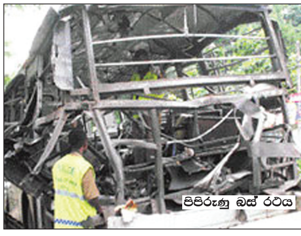
පිපිරුණු බස් රථය