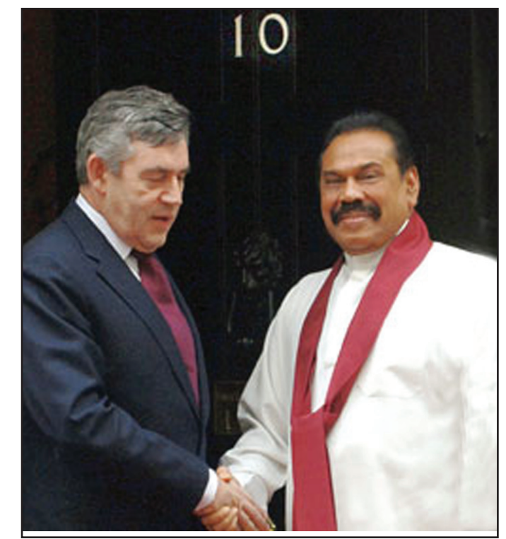
පොදුරාජ්‍ය මණ්ඩලීය සමුළුවට සහභාගිවීම සඳහා ලන්ඩනයට පැමිණ සිටින ජනාධිපති මහින්ද රාජපක්ෂ මහතා 9 වෙනි ආ මිත්‍රාණ අගමැති ගෝඨක් ඉටුන් මහතා අංක 10 බඩුතිං රිදියේ අගමැති නිල නිවසේ දී හමු වූ අවස්ථාවයි මේ.