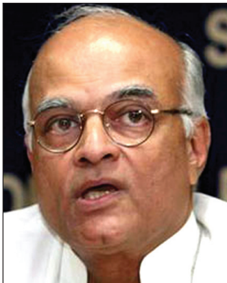
Shiv Shankar Menon Indian Security Advisor

දැනට දින දහයකට පමණ පෙර ඉන්දියාවේ ජාතික ආරක්ෂක උපදේශක ලෙස කටයුතුකරන ශිව ශංකර් මෙනන් හිටපු ලංකාවට දුටුගෙන ආවේ ය. කලකට පෙර ඔහු ශ්‍රී ලංකාවේ ඉන්දියානු මහකොමසාරිස් ලෙස කටයුතු කළ බව ඔබට මතක ඇත. දැන් ඔහු භාරතයේ ජාතික ආරක්ෂක උපදේශක ලෙස කැබිනට් තත්වයෙන් කටයුතු කරන්නෙකි.