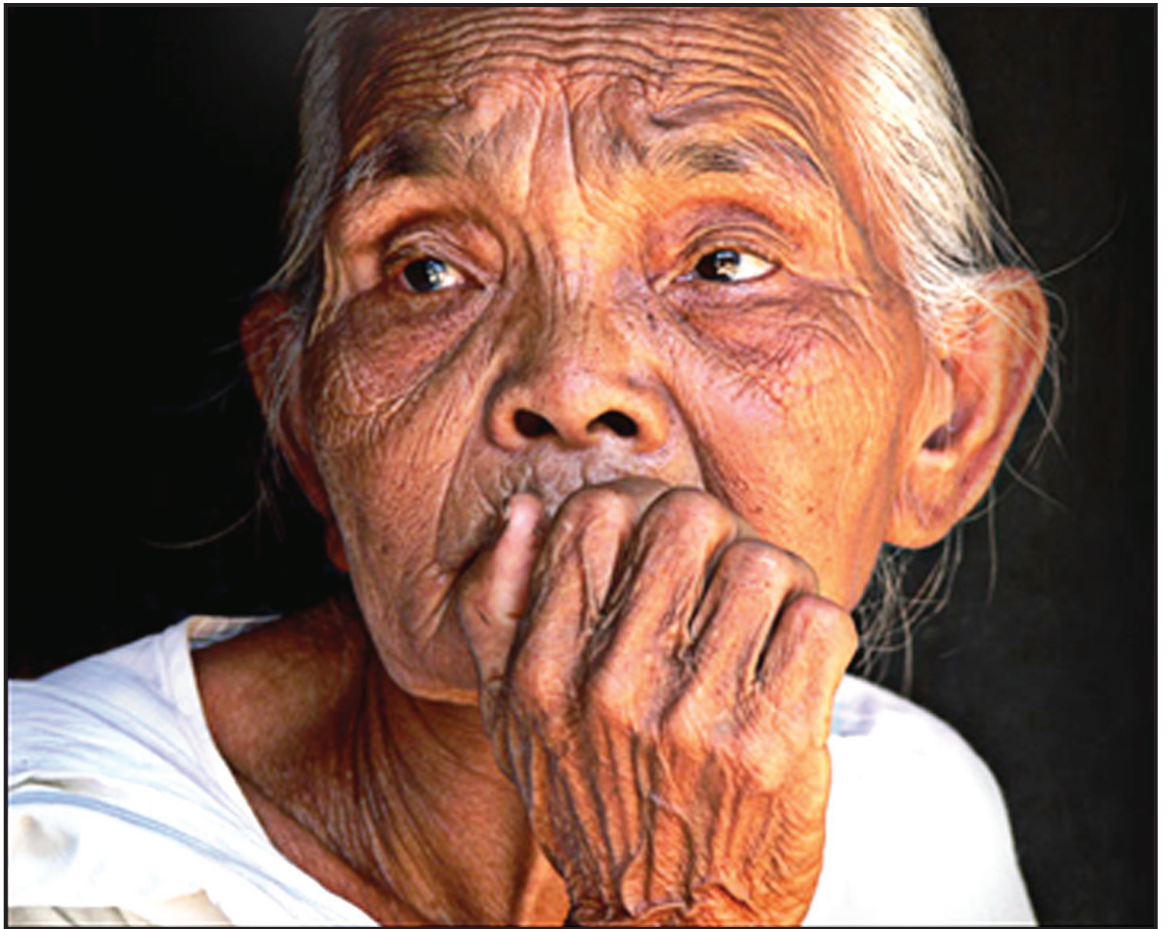
මේ පින්තූරය ගත් ජායාරූප ශිල්පියා කවුරුදැයි නොදනිමු. කවරෙකු හෝ වේවා ඔහුට අපගේ ස්තූතිය හිමිවේ.

මිනි මඩලේ අඳුරු කුසේ දිය උල්පත අම්මා . . . . .