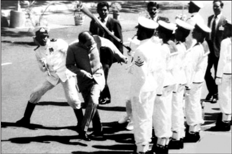
රජවී ගාන්ධි ලංකාවට ආ ප්‍රථම සහ එකම වතාවයි මේ

විසි අවුරුද්දක අත්දැකීම් සමග අප රට ද, රජය සහ ජනතාව ද, එදා වර්ගවාදී ගැටුම් ලෙස හැඳින්වූ තත්වයන්ද ආදී මේ සියල්ල වෙනස්වී