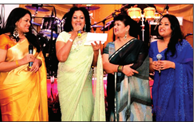
මාලිනී තම නැගණිය ශ්‍රියානි සහ ඇයගේ දියණියන් දෙදෙනාද එකතු කරගෙන සිය දෙමාපියන්ට උපහාර පිහිස අතිතයේ පබැඳු ගියක් මෙහිදී ගායනා කළාය.

ජාත්‍යන්තර සම්මානයට පත් ශ්‍රීලංකා වේ අසභාය සිනමා කලාකාරිය වශයෙන් අද දවසේ නිසැකවම හැඳින්විය හැකි ආවායී මාලිනී ලොන්සේකා මහත්මියට උපහාර දැක්වීමේ උළෙලක් සති දෙකකට ඉහත එනම් 2010 දෙසැම්බර් 31 වෙනි දින ලන්ඩනයේදී පැවැත්විණ. ඒදින මාලිනී රහපාමින් සම්මාන දිනු ආකාස කුසුම් චිත්‍රපටය ද නිර්ගත විය. කලාකාරී පිරිසක් සහභාගිවූ එහි ප්‍රධාන ආරාධිත අමුත්තා වූයේ ලන්ඩනයේ ශ්‍රීලංකා මහකොමසාරිස්වර විනිසුරු නිහාල් ජයසිංහ මහතාය. කලාකරු ජැක්සන් ඇන්තනි සහ සංගීතඥ කීර්ති පැස්කුවල් යන මහත් වරුද ශ්‍රීලංකාවේ සිට විශේෂ යෙන් පැමිණි අය වූහ. හිසුන් වහන්සේලා පිරිත් සජ්ජායනා කළ සේක.