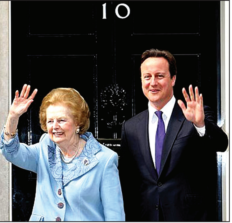
පැරණි අගමැතිගේ මාග්‍රට් තැවර් මහත්මිය, නව අගමැති ඩේවිඩ් කැමරන් මහතා හමුවන්නට ළඟදී අංක 10 නිල නිවසට පැමිණි දා එළියේ සිටින පිරිසකට ආචාර දක්වන අයුරු

බ්‍රිතාන්‍ය නව අගමැතිවරයා පත්වීමත් සමග බොහෝ ජනමාධ්‍ය ආවරණයන්හි විශේෂ නිවසක් ගැන සඳහන් වීණ. ඒ ලන්ඩනයේ ඩවුන්ග් වීදියේ අංක 10 නිවාසයයි ( No: 10 Downing Street) හෙවත් මහා බ්‍රිතාන්‍යයේ අගමැතිවරුන්ගේ නිල නිවාසයයි. මෙම නිවස ගැන ලොව පුරා ජනතාව දැන සිටිති. විශේෂයෙන් මෙය බොහෝ උද්ඝෝෂණ හා විරෝධතාවන්හි දී ලියවිලි සහ පෙත්සම් අගමැතිවරයාට ඉදිරි පත්කරන්නට බාරදෙන ස්ථානය වී ඇති නිසාත් ය. බොහෝ රාජ්‍ය නායකයෝ මෙහි අගමැතිවරයා හමුවන්නේ මෙතැන් හිදීය. එසේම නව අගමැතිවරයෙකු පත්වූ පසුද පරණ අගමැති ඉවත්ව යනවිට ද මාධ්‍යවේදීන් හා ඡායාරූප ශිල්පීන් මේ අංක 10 නිවස අසලට රොක් වෙති. අගමැතිවරයා ඔවුන්ට අත වනන්නේ මේ දොරකඩ සිට ය. වර්ෂ 1645 දී බ්‍රිතාන්‍යයේ ඉහළ පෙළේ රාජ්‍ය නිලධාරියෙකු වන ජෝර්ජ් ඩවුන්ග් හට දෙවන වාර්ල්ස් රජු විසින් විශාල ඉඩමක් ලබා දෙන ලදී. මෙම ඉඩම ජේම්ස් උද්‍යානයට අයත් කොටසකි.