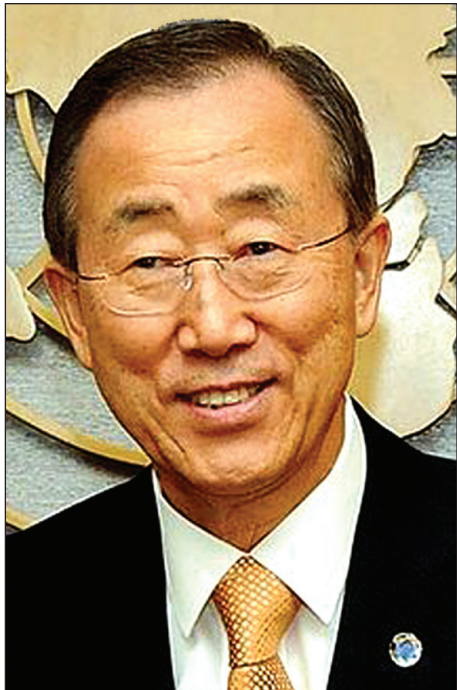
බැන්කි මුන් ගේ කමිටුව

සංවර්ධනය වූ බටහිර රටවල මෙන් අප රට ශ්‍රී ලංකාවේ නිෂ්පාදකයාද, වෙළෙන්දාද, පාරිභෝගිකයාද යන තුන් පිරිස අතර සාධාරණත්වය පදනම්කරගත් නුවමාරුවක් සිදු නොවේ. එ නිසා පාරිභෝගිකයාගේ යහපත සඳහා කටයුතු කරන සකොස, සම්ප්‍රජාකාරය වැනි රාජ්‍ය අනුග්‍රහය යටතේ ක්‍රියාත්මක වන සංස්ථාවන්ගේ මැදිහත්වීම අවශ්‍ය ය. එමගින් වෙළඳ මාරියාවේ අහිතකර ක්‍රියාකාරීත්වය අවමකර සාමාන්‍ය ජනයාට සාධාරණයක් ඉටුකර ගත හැකි වෙළඳාම් ක්‍රමයක් ස්ථාපනය කරගත හැකි වෙතවා ඇත.