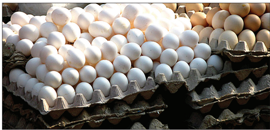
ශ්‍රීලංකාවට ඉන්දියාවෙන් ලෙන දී ගෙන ආ බිත්තර තොගයක්