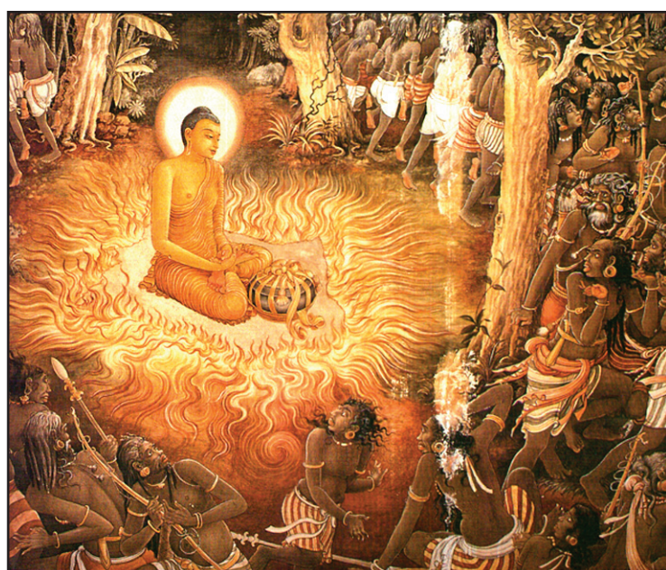
මහියංගනයට දුරුතු පොහෝදා බුදුන්වහන්සේ වැඩම කර එහි දී යසක ගෝත්‍රිකයින් දමනය කළ බව දැක්වෙන කැළණි විහාරයේ චිත්‍රය

ශාස්ත්‍රවේදී පණ්ඩිත භෞරණ පඤ්ඤාඥෙබර මහා ස්ථවිරයන් වහන්සේ