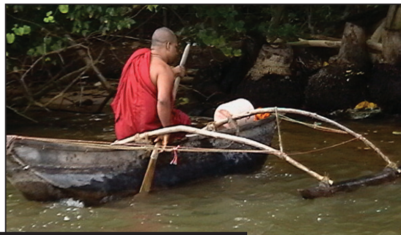
බුදු හාමුදුරුවන්ගේ උපමා කතා