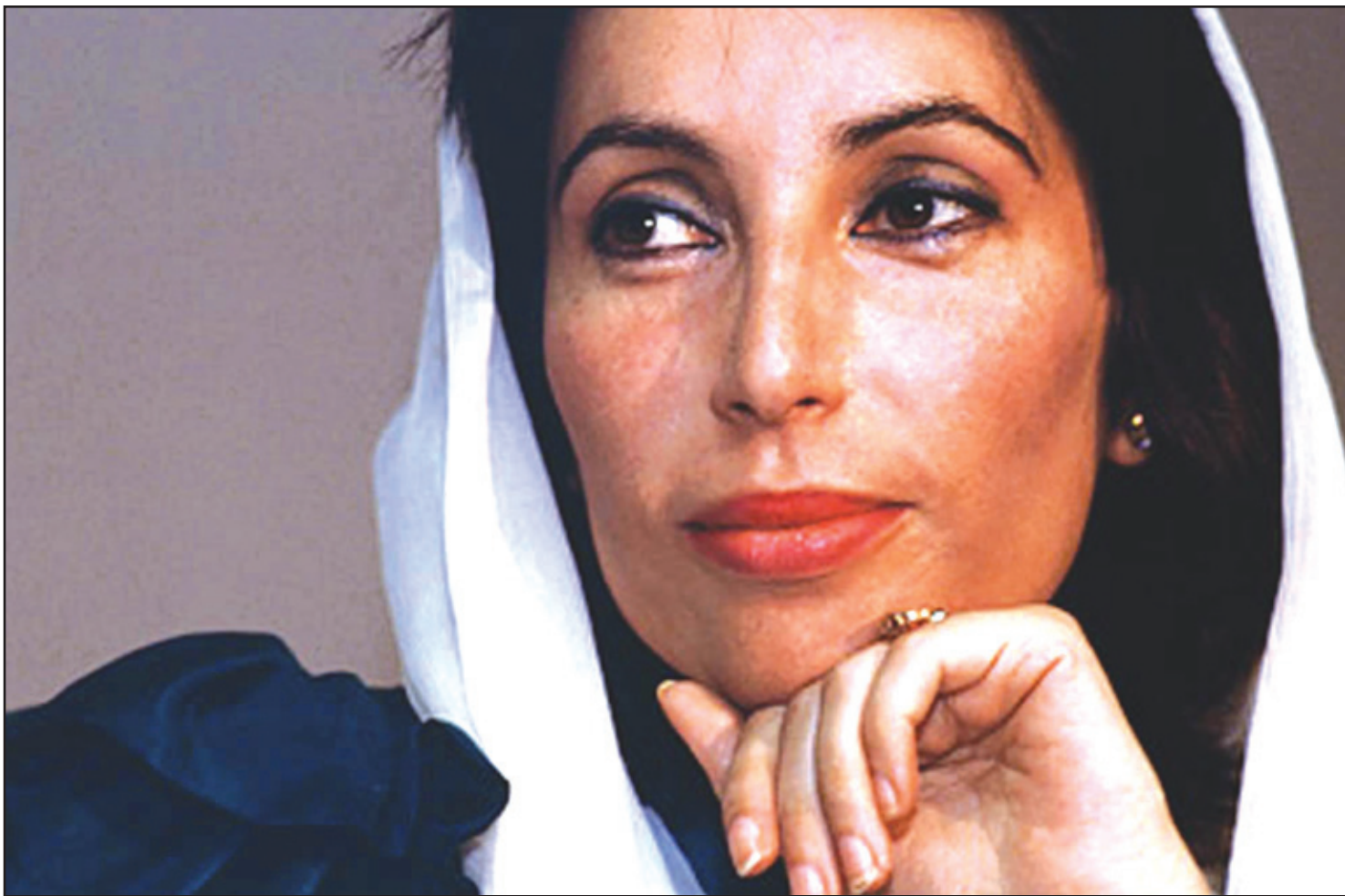
බෙනාසිර් භුතෝ Benazir Bhutto (1953 - 2007) - former Prime Minister & Opposition Leader of Pakistan

JANUARY 10, 2008 ජනවාරි මාසය (බුද්ධ වර්ෂ 2551 දුරතු මාසය)