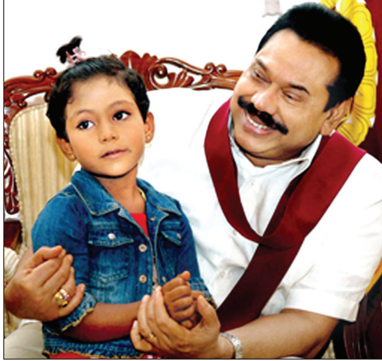
ජනාධිපතිවරයා පිහිනුම් ඉරි ඕෂඩ් දැරිය සමඟ

Nearest railway station - Liverpool Street (tube & rail) Bishop Gate Exit