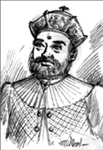
ශ්‍රී වික්‍රම රාජසිංහ රජු

මානව ඉතිහාසයේ සිදුවූ මහා පාචාදීමේ කතාන්තරය කියන, ඉහත චිත්‍රය දෙස බලන්න. මේ 1815 පෙබරවාරි මස 18 වන දින සිංහලේ අවසාන රජු වන ශ්‍රී වික්‍රම රාජසිංහ රජතුමා සිය බිසෝවරුන් සිව්දෙනා සමඟ බෝම්බර්ගේ ආරවිවිගේ නිවසේ සැඟ වී සිටිය දී උඩරට සිංහල නිලමෙවරුන්ගේ ද සහාය ඇතිව ඉංග්‍රීසීන් විසින් අල්ලා ගන්නා ලද අවස්ථාවයි.