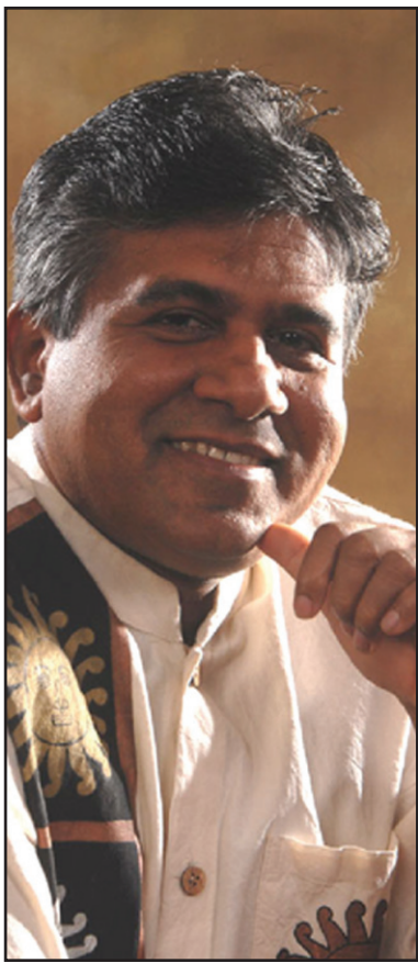
විජයදාස රාජපක්ෂ මහතා

ශ්‍රී ලංකාවේ දේශපාලන, කලා සහ නීති ක්ෂේත්‍රයේ අපූර්ව සිදුවීම් විය. පූර්වයේ නොවූ දේ අපූර්ව නම් වේ. එසේම දේශපාලනඥයෙකු, ජනාධිපති නීතිඥයෙකු විසින් එක්වර නීති ග්‍රන්ථ 5 ක් ද, හිරු සදු අරණ නමින් තම ගීත රචනා 18 ක් අඩංගු සංයුක්ත කෘතියක් ද, සුදු පාචාඩ නමින් නවකථා පොතක් ද, සංගීත පාමුල නමින් පද්‍ය ග්‍රන්ථයක් ද, Beyond the Horizon නමින් ඉංග්‍රීසි කාව්‍යයක්ද, අගනි දේශ නමින් තමන් විසින්ම තීර රචනා කොට අධ්‍යක්ෂණය කළ කෙටි චිත්‍රපටයක් ද එකම දිනක එළි දක්වනු ලැබීමේ උත්සව යක් පැවැත්වීම මෙම අපූර්ව සිදුවීම ය.