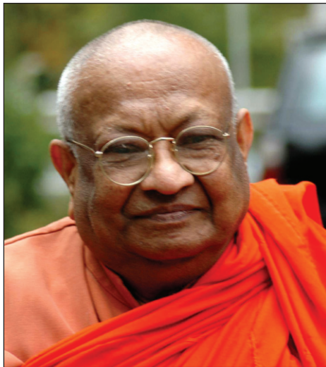
අනෙක පුවත්පත් හා සභාරාලට ලිපි සැපයීමෙන්ද ඉමහත් මෙහෙවරක් ඉටු කළා.”

“සිංහල ධාතෘත්‍ය සහ බෞද්ධ සංස්කෘතිය ගැන මනා අවබෝධයක් බේමානන්ද හිමියන්ට තිබූ අතර නිව්යෝර්ක් නුවර පළවූ බෝසත් සභාරාච සංස්කරණය කිරීමෙන්ද වෙනත්