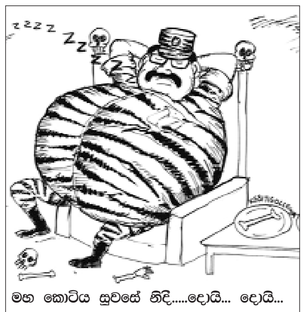
මහ කොටිය සුවසේ හිඳි.....දොයි... දොයි...