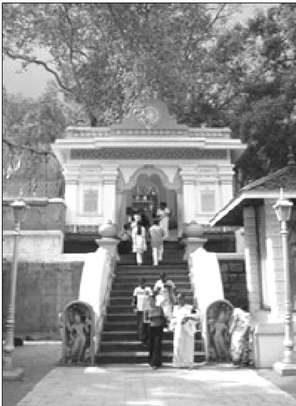
අනුරාධපුරයේ ශ්‍රී මහා බෝධීන්වහන්සේ

අප ජීවත්වන විශ්වයට අයත් සියළුම දේ ක්‍රියාත්මක, යොහෝවා, දෙවියන් වහන්සේ, හෝ අල්ලා යනුවෙන් ජීවමාන ආත්මයක් ලෙස මුර්තිමත් කොට ඇති ස්වභාව ධර්මයේ ආධිපත්‍යයට යටත්වෙතව. බුදු පසේබුදු මත රහතත් වහන්සේලා පවා ස්වභාව ධර්මයට යටත්. උන්වහන්සේලා විසපත්ව, ජරාපීරණව, ලෙඩ රෝග වලට ගොදුරු වී අවසන් සුසුම් හෙලන්නේ ස්වභාව ධර්මයට යටත්වයි. මේ අනුව විශ්වයේ අධිපතියා ස්වභාව ධර්මයයි. ඒ ධර්මයට අනුරූපීවම සද්ධර්මයයි. පටහැනිවීම අසද්ධර්මයයි.