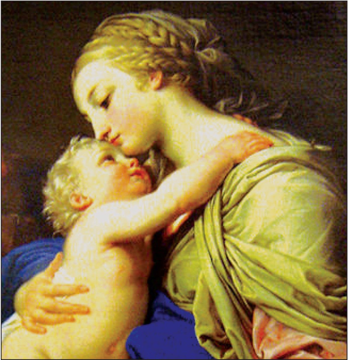
ජේසු බිළිඳු සහ දේව මාතාව Madona & Child - A Painting by Pompeo Batoni (1708-1787)

නයිජීරියාව 1960 දී බ්‍රිතාන්‍ය පාලනයෙන් නිදහස ලබන විට ද එහි අන්තිම ප්‍රදේශයේ බණිප් තෙල් ලැබී බ්‍රිතාන්‍ය පෙට්‍රොලියම් සමාගම් එම ජාවාරමේ යෙදී සිටියහ. නිදහස ලබාගැනීමෙන් පසුව ද ඒවා එලෙසම කටයුතු කළ ද එම තෙල් සම්පත ජාතිය සතු කිරීමේ අදහස මතු වී තිබිණ. මේ තෙල් ලී-