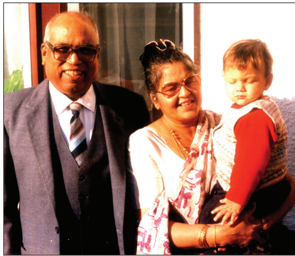
බුදුවල යුවල තම මුහුණට සමග 1998 දී

ලන්ඩන් වල අපේ ලංකා මයිසියක් අපි අරිනවා. එක බලාගන්න මම පොඩි ඔවර්සියර් යවනවා. ලැස්ති වෙන්ත ලන්ඩන් යන්න. බුදු අන්දන් කුන්දන් විය. ලන්ඩන් එන්නට ඔහු කිසිදා හිතා හිටියේ නැත. මහා නිදහස් උළෙලක් පැවැත්වෙන්නට යන බව පැතිරී තිබුණි තව ඇත්තේ දින කිපයකි. ලන්ඩන් ගියොත් එය බලන්න ලැබෙන්නේ නැත. “මහත්තෙයෝ මම උත්සවේ බලලම යන්නද?” ඔහු සේනානායක මහතාගෙන් ඇසී ය. “නා හොඳයි. එහෙනම් උත්සවේට පහුවෙන්නද ම නැවතගින්න ඕන.....” 1948 පෙබරවාරි 10 වෙනි දින කොළඹ නිදහස් වතුරගුයේදී ගලොස්වර්ගි ආර්යාද-වරයා ප්‍රධාන බ්‍රිතාන්‍ය සම්භාවනීය අමුත්තන්ගේ සභාගිතවයෙන් අත්‍යාලංකාර ලෙස ශ්‍රී ලංකාවේ ප්‍රථම නිදහස් උත්සවය පැවැත්විණ. කොළඹ පමණක් නොව මුළු මහත් ලංකාවම එකම මතුල් ගෙයක් විය. නිදහස් වතුරගුය අවට ලක්ෂ සංඛ්‍යාත ජනී ජනයාගෙන් පිරිගොස් එකම හිස්ගොඩක් බවට පත්විණ. නිදහස් වතුරගු මණ්ඩපයේ කොණක සිට උත්සවය නරඹන්නට බුළුවල මහතාට හැකිවිය. ඊට දින දෙකකට පසු ඔහු එංගලන්තය බලා නැව් නැංගේය. එදා සිට ඔහු මේ දක්වාම ලන්ඩනයේ ජීවත්වූයේය. ට්‍රැපල්ලා වතුරගුය අසල වූ Dominion of Ceylon දැන් ඇමරිකානු කානාපති කාර්යාලය ඇති නැනට ගෙනයන