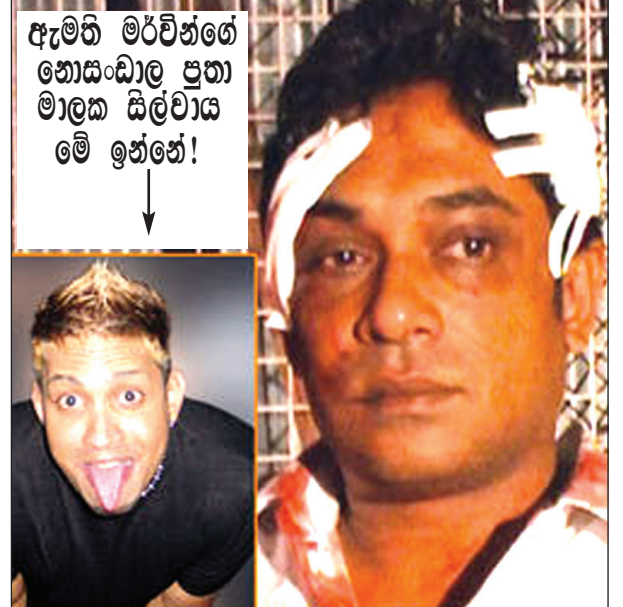
ඇමති මර්ටින්ගේ නොසංඛාල ප්‍රභා මාලක සිල්වායි මේ ඉන්නේ!