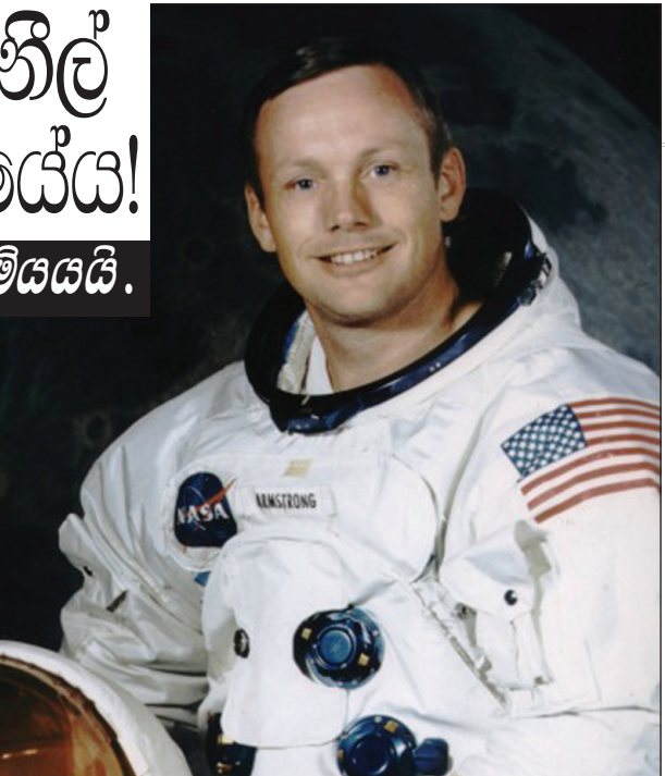
නිල් එදා සඳට ගොඩබැස්ස දින ගත් ජායාරූපය

එදා මුල්වරට තෙපලු වචන මෙසේ වෙයි. "මේ තැබූ අධිය මිනිසෙකුගේ ඉතා පුංචි අධියකි..... එහෙත් මෙය සමස්ථ මිනිස් ප්‍රජාවගේ මහා යෝධ පිම්මකි....." නිල්ගේ එම වචන කිපය ලොව පුරා මිලියන වාරයකට වඩා අවශ්‍ය තනි උපුටා දැක්වා තිබේ. ඉදිරියට ද එසේ වෙනවා ඇත. ඇමරිකාවේ ඕනියෝ හි ඉපිද එහිම හැදී වැඩි පාසැල් ගිය නිල් පාසැලේදී විද්‍යාවට සහ ගණිතයට දක්ෂයෙකු විය. නාවුක හමුදා ශිෂ්‍යත්වයක් ලැබ ඔහු අප්‍රිකානු ඉන්ජිනේරු විද්‍යාව හදාරා ඉන්ධියානා සරසවියෙන් උපාධියක් ද සමත් විය. මෝටර් රථ බලපත්‍රයක් ගන්නටත් පෙර ඔහුට ගුවන්යානා පදවන්නට පයිලට් බලපත්‍රයක් ගත හැකි විය. ගුවන් යානා කෙරෙහි වූ ඔහුගේ ඇල්ම ඉමහත්ය