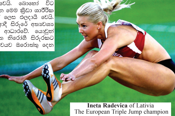
Ineta Radevica of Latvia The European Triple Jump champion

ක්‍රිකට් යනු ගිම්හාන සෘතුවේදී එහි දීර්ඝ දහවල් කාලය ගෙවා ගැනීමට එංගලන්තයේ ඉංග්‍රීසී ජාතික පිරිමින් විසින් වික්ටෝ-රියානු රාජ්‍ය සමයේ ගොඩ නගා ගන්නාලද කම්මැළි ක්‍රීඩාවකි. ක්‍රිකානා රාජ්‍ය සමයේ එහි යටත් විජිතවලට මෙම ක්‍රීඩාව ව්‍යාප්තවිය. එහෙත් යුරෝපයේ වත් ක්‍රිකට් ව්‍යාප්ත වූයේ නැත. ලෝකයේ