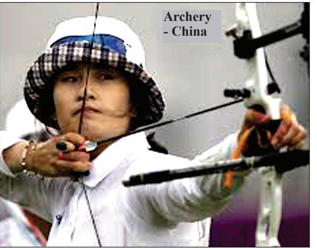
Archery - China