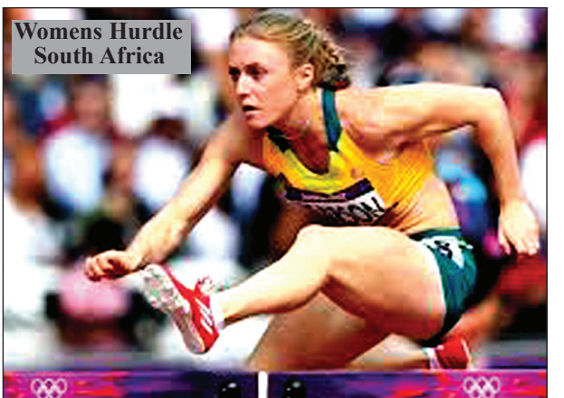
Womens Hurdle South Africa