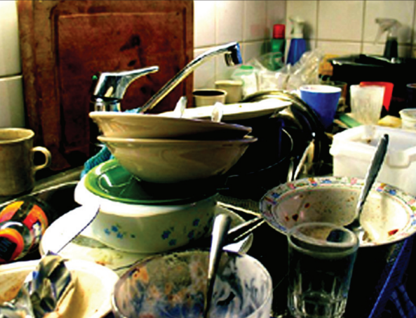
ශ්‍රී ලංකාවේ හෝටලයක කුසියේ හැටිය මේ