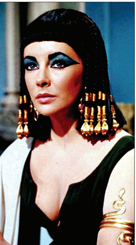
Elizabeth Taylor in 'Cleopatra'

ලමා වර්ත ඇය වෙත ඇදී එන්නට විය. Lassie come home 1943, Jane Eyre 1944, The White cliff of Dover 1944, National Velvet 1944, ඉන් කීපයකි. එළිසබෙත් ටේලර් තරුණියක හැටියට රන පැ ප්‍රථම විත්‍රපටය 1950 දී තිරගත වූ Father of the Bride විය. එවිට ඇගේ වයස අවුරුදු 17 කි. එතැන් පටන් ඇය සිටි විත්‍රපට රැසක් ලොව පුරා සිනමා ලෝචී රසිකයින් වසහකර බැඳ තබන්නට සමත් වූයේය. ඊවර්ඩ් බර්ටන් සමග ඇය රහස්‍ය දවැන්න හොලිවුඩ් නිශ්පාදනය ක්‍රියාත්මක වූ ඇන් කාටන් අමතක නොවන්නකි. ඇය කිව යුතු දේ නොපැකිලිව කියන කරන සාක්ෂි ගැහැණියක ලෙස කවුරුත් හඳුනාති. බල්ලන් බලලන්ට ඇය දැකවූ ආදරයද ඉමහත්ය. එයින් රෝග මර්දන ව්‍යාපාරයට ද ස දහස් ගණනක් මුදල් පරිත්‍යාග කළ ඇයට ඇමරිකාව ඇතුළු විවිධ යුරෝපීය රටවලින් සමාජසේවා සම්මානද, බ්‍රිතාන්‍ය මහ රැජිණ ගෙන් DBE හෙවත් Dame of British Empire ගෞරව නාමයද පිරිනමනු ලැබිණි. ලියි ටේලර් සිය ජීවිතයේ කොතෙක් පිරිමින් ඇසුරු කළද යන්න දන්නේ ඇය පමණි. ප්‍රකට ජීවිතයේ පිරිමින් හත් අට දෙනෙකු සම්පව ඇසුරුකළා පමණක් නොව ඔවුන් හා විවාහද වූවාය. එහෙත් ඒවා කෙළවර වූයේ අධිකරණ හා දික්කසාදවීම් ය. ඇගේ විවාහ ජීවිතයේ විශේෂත්වයක් වන්නේ බ්‍රිතාන්‍යයේ ප්‍රකට වෙළඳ ජාතික නම රිචර්ඩ් බර්ටන් හා පෙමින් වෙළී ඔහු හා විවාහ වී, දික්කසාද වී, යළිත් විවාහ වී මයි. ඇයකියන්නේ ඇයට වඩාත් සෙනෙහෙ පිදු සැමියා බර්ටන් බවය. එනියා ඇය රිචර්ඩ් බර්ටන් අධ්‍යාපනය ලැබූ ඔක්ස්ෆර්ඩ් විශ්වවිද්‍යාලයේ නාට්‍ය ශාලාවට මුදල් පරිත්‍යාග කළාය. එම නාට්‍ය ශාලාවේ පුහුණු කිරීමේ ශාලාව නමිකර ඇත්තේ Elizabeth - Burton Room යනුවෙනි. 1957 දී තමාට වඩා අවුරුදු 23 කින් වැඩිමහල් ධනකුචේරියෙකු වන මයිකල් ටොඩ් සමගද, 1991 දී අවුරුදු 23 කින් බාල