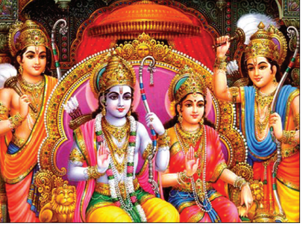
රාමා හා සීතා විවාහ වූ දා මංගල ජායාරූපය